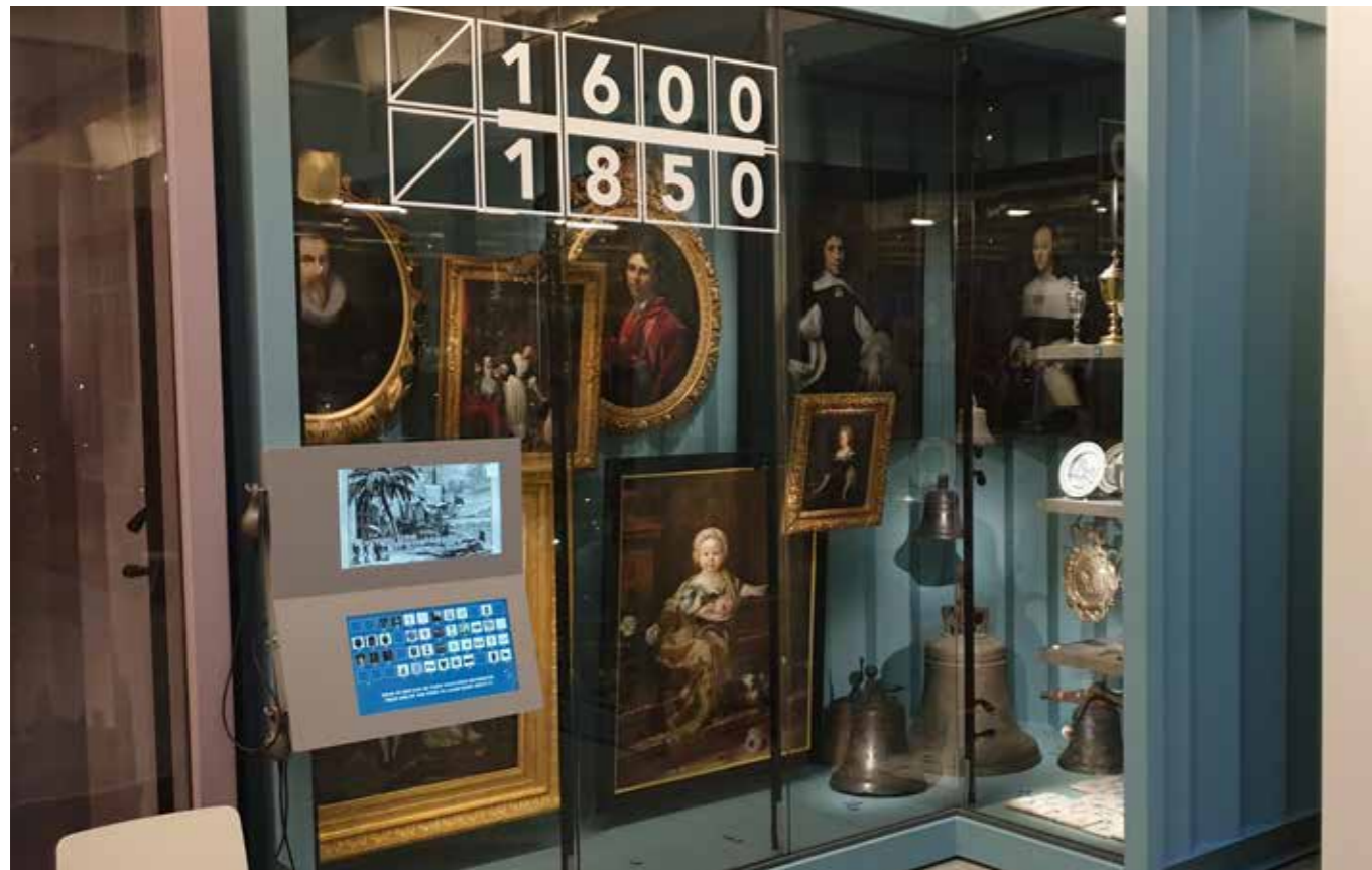
Op de museumlocatie aan het Rodezand worden schilderijen noodgedwongen in geklimatiseerde vitrines gepresenteerd.

museumlocatie in het Timmerhuis worden kwetsbare objecten buiten de geklimatiseerde containers gemonitord door externe restauratoren. Van een open opstelling is op die locatie daarom beperkt sprake. De meeste schilderijen en ook grote voorwerpen worden in de geklimatiseerde containers getoond, wat de beleving van het voorwerp door het publiek niet ten goede komt. Vanwege de gebrekkige expositiemogelijkheden liep Museum Rotterdam bijna een financiële ondersteuning mis van de Vereniging Rembrandt.