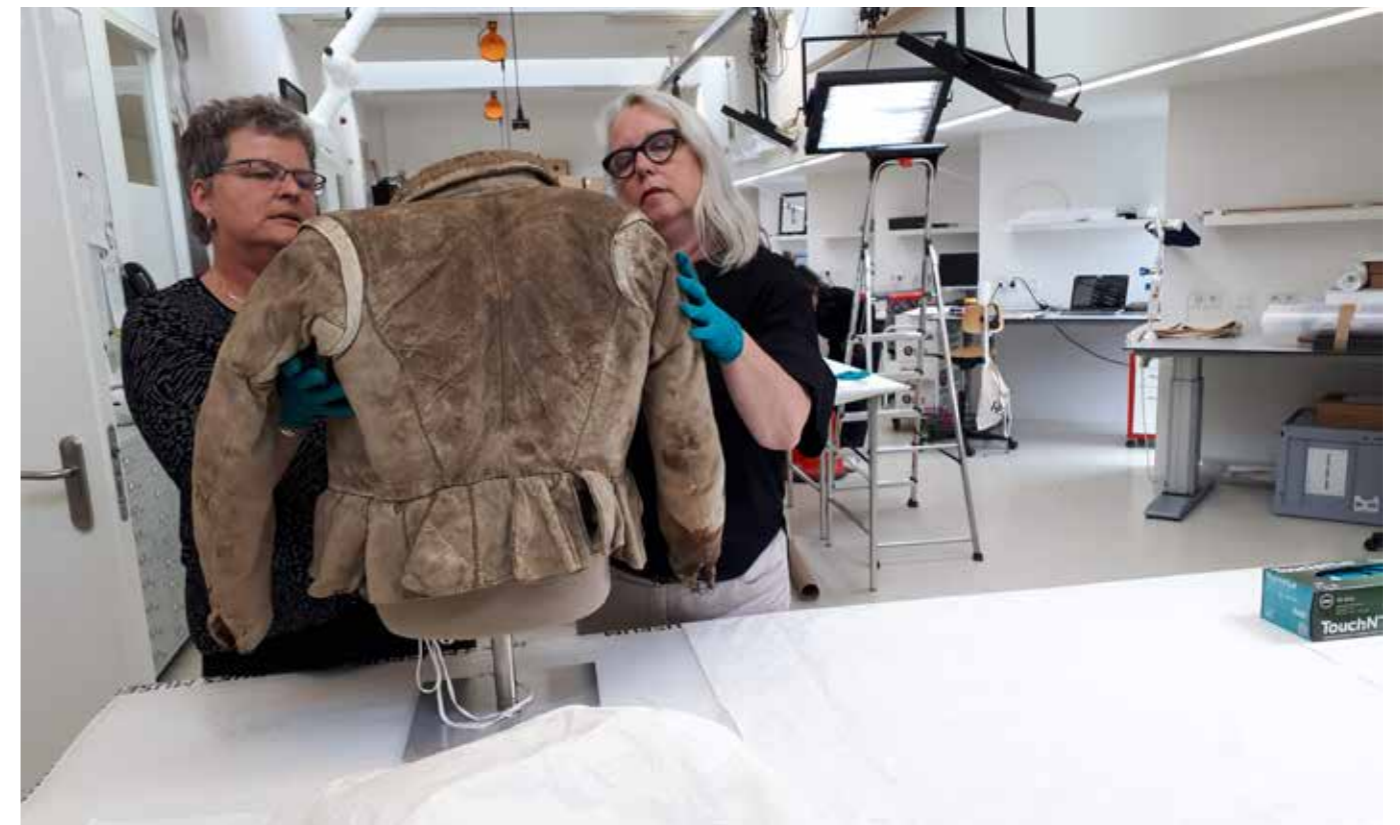
Museum Rotterdam en het Rijksatelier bereiden het jasje van Hugo de Groot (ca. 1600) voor, voor een tv serie met AVRO/TROS