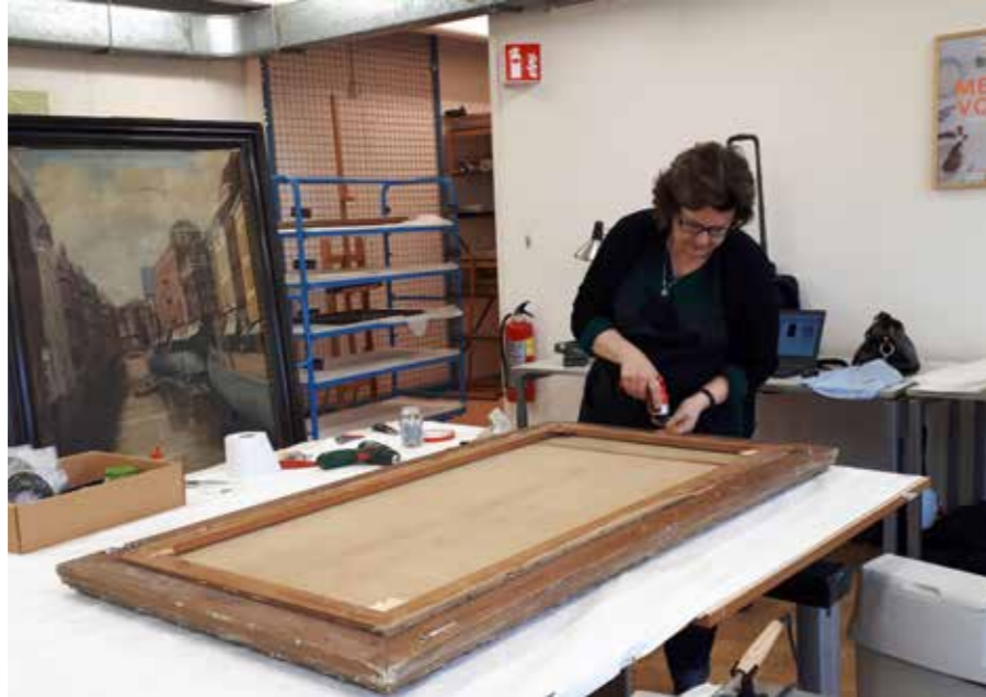
Een dag per maand controleert een extern restaurator ongeveer 6 a 8 schilderijen volgens de APC methode