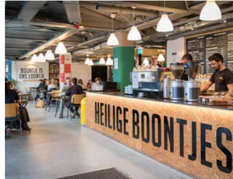
Koffiebar Heilige Boontjes begeleidt jongeren van de straat naar betaald werk. 'Echt Rotterdams Erfgoed' nr. 30