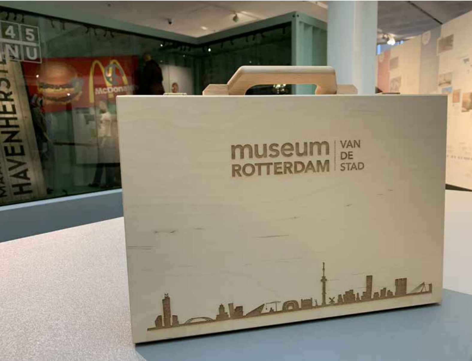
Het educatiekoffertje van Museum Rotterdam. In de koffer zit het lesmateriaal waarmee scholieren aan de slag gaan