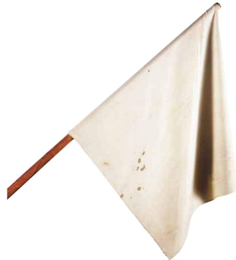
De capitulatievlag van Museum Rotterdam geldt als een van topstukken van Museum Rotterdam

Het waardestellend kader uitgedrukt in de A t/m D categorie is vanwege de omvang en aard van de collectie en vanwege personeelsgebrek nauwelijks uitgevoerd. Met uitzondering van de meubelcollectie zijn verder enkele deelcollecties op hoofdlijnen uitgewerkt.