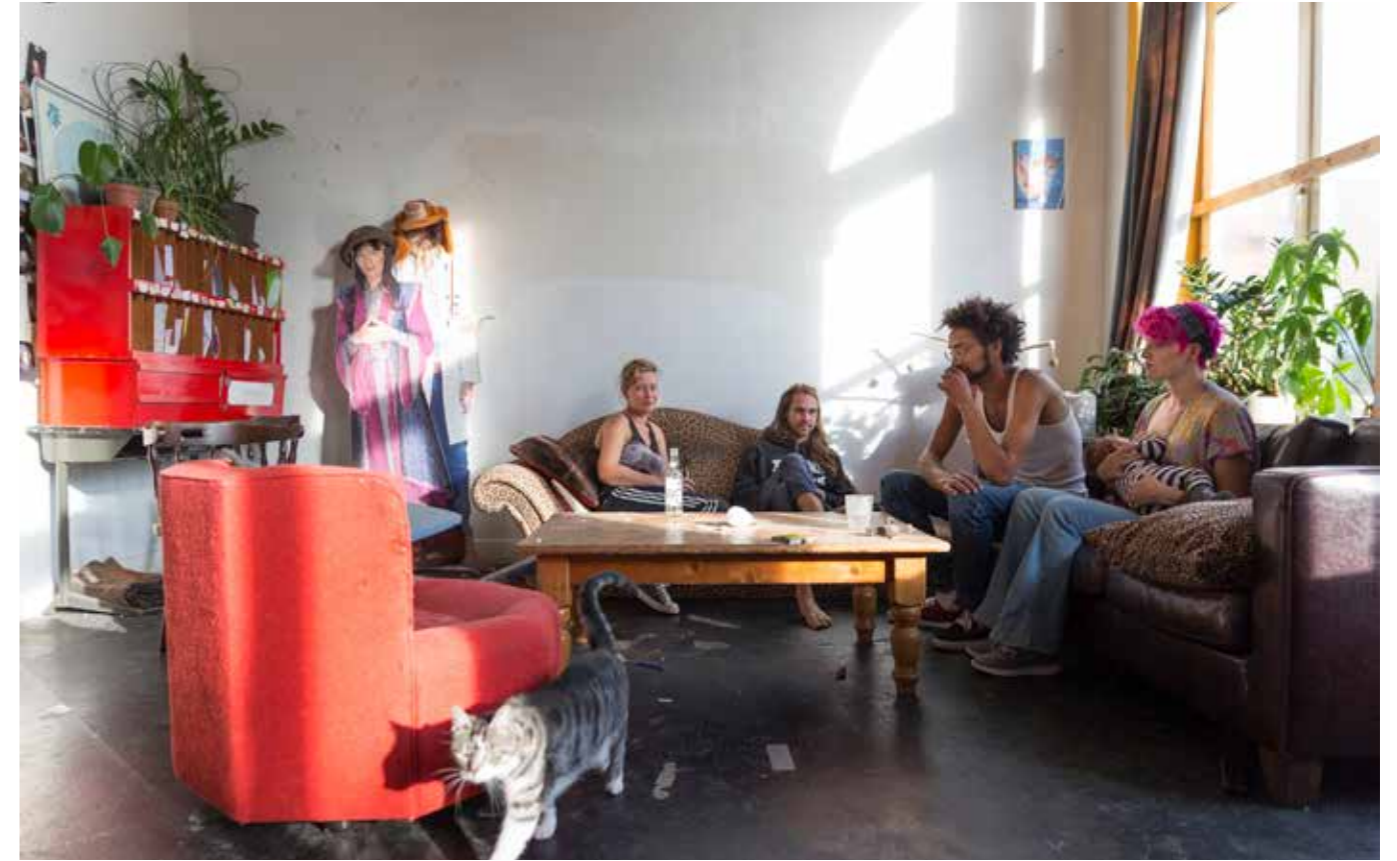
Malou van den Berg fotografeerde Rotterdammers thuis om 18:30 uur vanuit haar overtuiging dat mensen dichter bij elkaar komen als we zien wat ons verbindt

afronding van het onderzoek naar het verzamelen van hedendaagse wooncultuur prioriteit. Dit onderzoek 5 resulteert in een dissertatie (2020-2021), die ook toegankelijk zal worden gemaakt voor een breder publiek. Bovendien zal – op basis van het model – de deelcollectie 'Wooncultuur' daadwerkelijk worden uitgebreid.