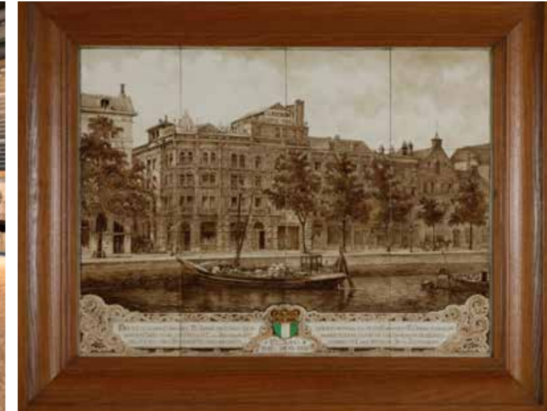
Tegeltableau koffiebranderij IJsendijk aan de Leuvehaven 1930 laat een historische link zien met koffiebar Heilige Boontjes

De collectie die wordt beheerd door Museum Rotterdam is procentueel gezien vrijwel volledig gemeentelijk bezit. Een heel klein deel wordt gevormd door langdurige bruikleen van andere instellingen zoals het Rijksmuseum, de Rijksdienst Cultureel Erfgoed en (particuliere) stichtingen evenals een bruikleen van de Stichting OorlogsVerzetsMuseum Rotterdam.