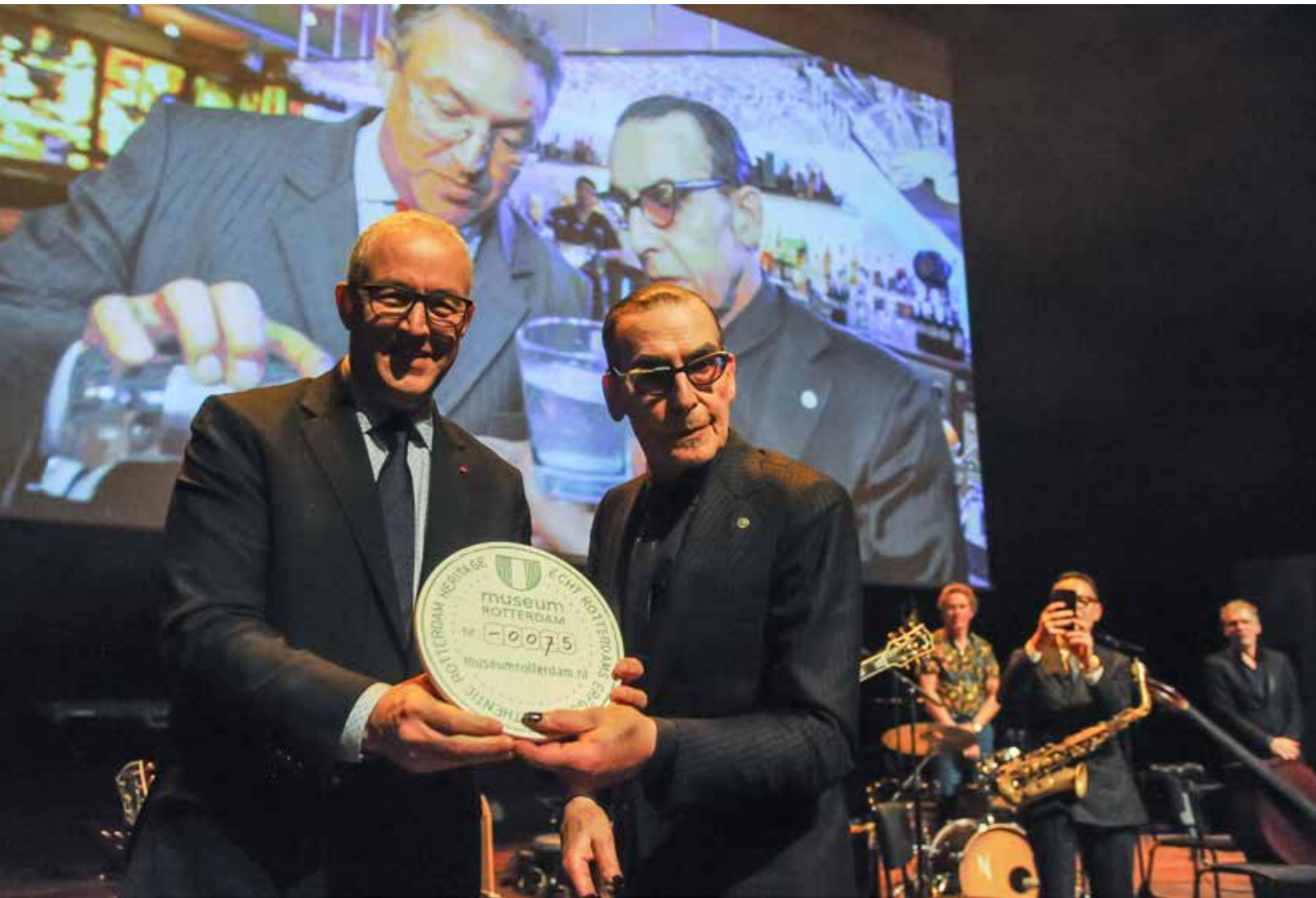
Burgemeester Aboutaleb reikt het 'Echt Rotterdams Erfgoed' certificaat uit aan Jules Deelder op zijn verjaardag in de Doelen.

Rijnmond. Voor objecten over het dagelijks leven van Rotterdammers geldt deze geografische beperking minder.