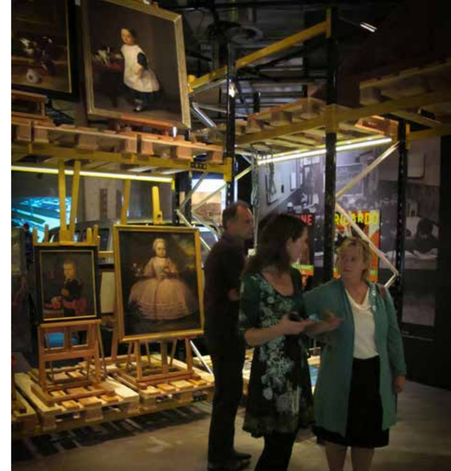
Een voorbeeld van een open opstelling zoals gerealiseerd in de tentoonstelling Echte Rotterdammers I in Las Palmas 2