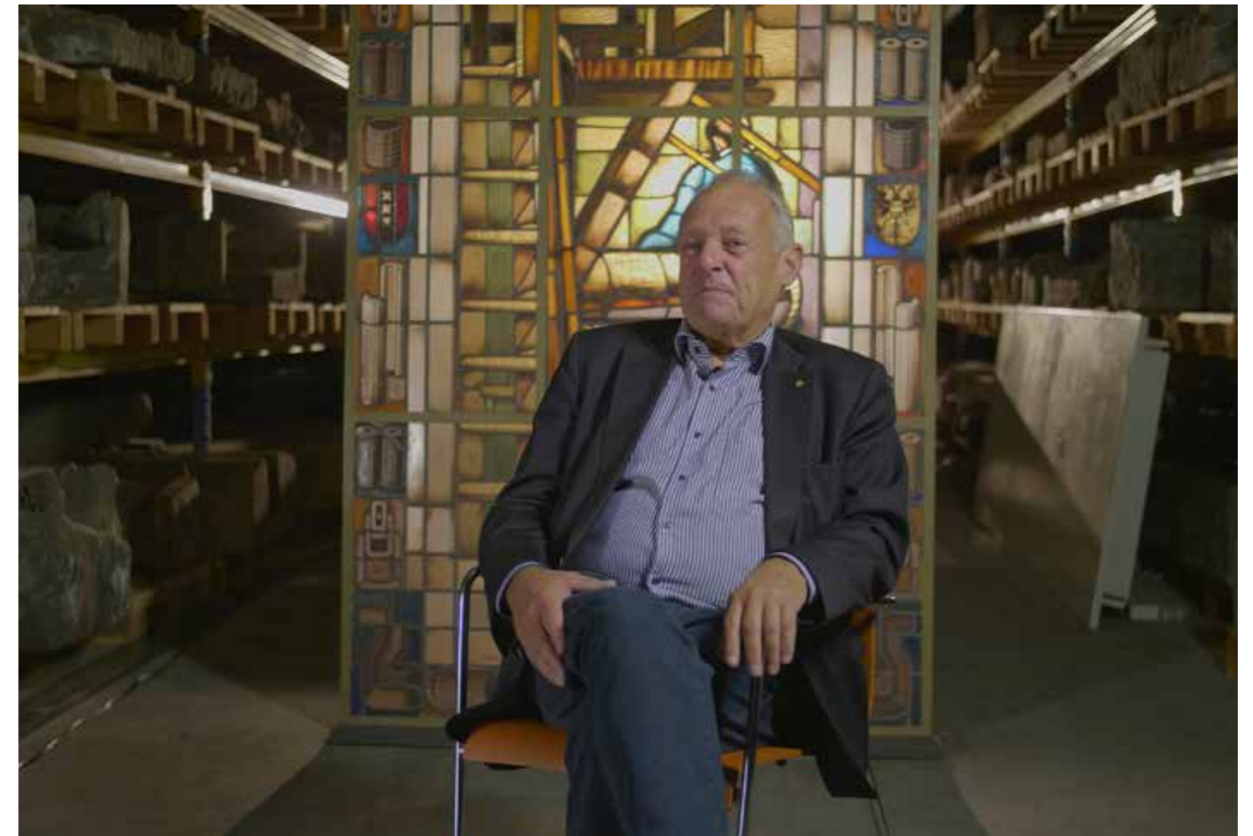
De schenker van dit glas-in-lood en oud directeur van een isolatiebedrijf vertelt in een documentaire over de bedrijfsgeschiedenis