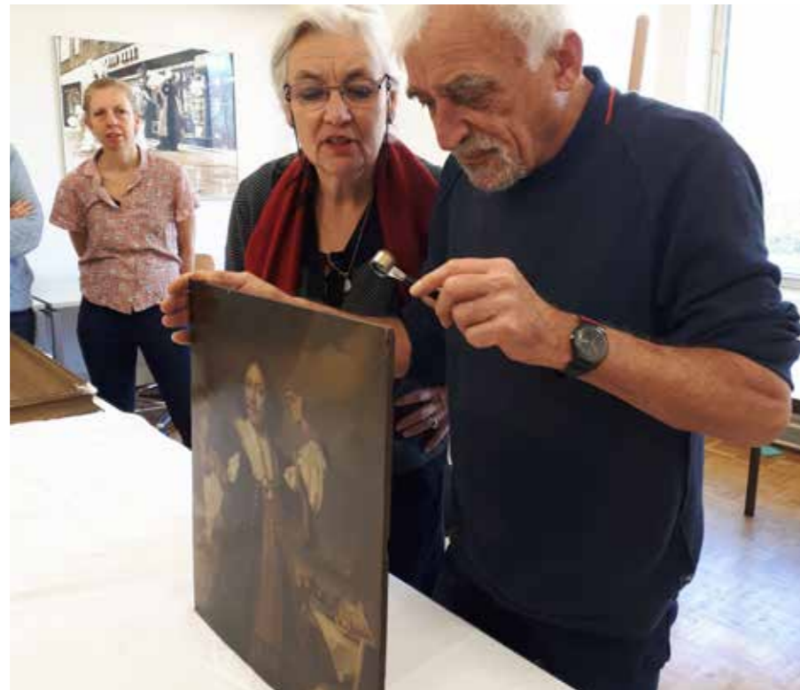
Multidisciplinair onderzoek heeft bij het portret van Aert van Nes geleid tot een andere toeschrijving

van ondernemerschap zijn verkend in het project 'Echt Rotterdams Erfgoed'. Bijna de helft van de 75 initiatieven die nu aan deze 'actieve collectie' van Museum Rotterdam zijn toegevoegd, is gerelateerd aan innovatief en verbindend ondernemerschap binnen het midden- en kleinbedrijf. Vaak liggen transnationale netwerken hieraan ten grondslag. In de komende periode wordt onderzocht in hoeverre het mogelijk is dit actuele, en vaak immateriële erfgoed, een plaats te geven in de historische collectie. Aansluitend hierop zal het thema van arbeidsmigratie de komende tijd beter in historisch perspectief worden geplaatst.