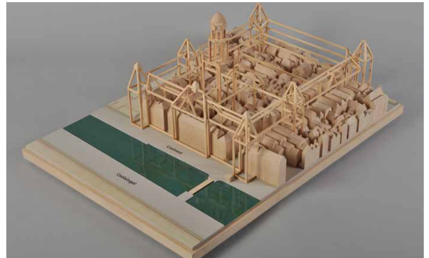
Maquette van de Zandstraatbuurt met draadmodel van het Stadhuis van Rotterdam gemaakt in opdracht van Museum Rotterdam

Op de overige deelcollecties wordt terughoudend verzameld. Collecties van gemeentelijke diensten worden gemakkelijk veel te groot en daardoor onbeheersbaar. De collectie 'Heraldiek' wordt retrospectief verzameld en als bijna volledig beschouwd. De verzameling 'Openbaar vermaak' richt zich op de grootstedse festivals die typisch Rotterdams zijn.