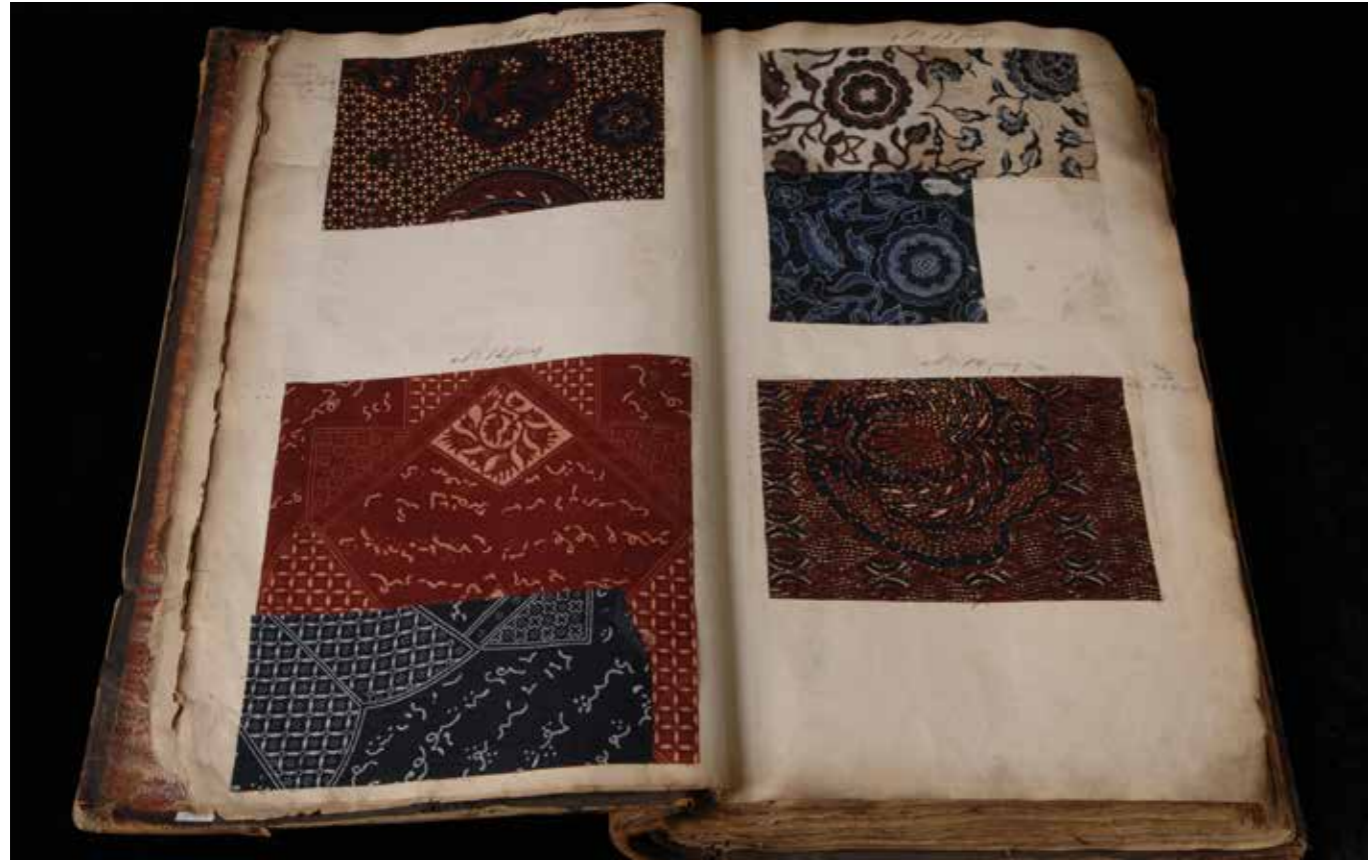
De Kralingse Katoenmaatschappij produceerde stoffen voor de internationale markten zoals in Azië en Afrika 4

draagt bij aan het unieke karakter van de collectie. De textielcollectie is relevant voor de stadshistorische collectie en de deelcollectie 'Bedrijf en techniek'. In rotterdamkaart.nl worden deze collecties geïntegreerd getoond.